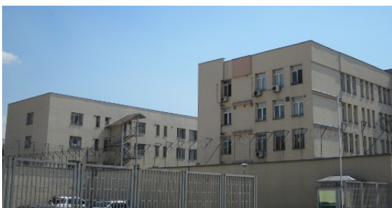
Detentioncenter in Busmantsi

Misshandlungen durch die bulgarische Polizei, unter anderem in Isolationszellen 26 . Der Organisation Center for Legal Aid - Voice in Bulgaria (CLA) zufolge wurden laut dem bulgarischen Innenministerium im Jahr 2015 in den Abschiebegefängnissen Lyubimets und Busmantsi 11.902 Personen festgehalten 27 . Die bulgarische Ombudsfrau, Maja Manolowa, veröffentlichte im März 2016 einen Bericht, wonach unbegleitete minderjährige Flüchtlinge (umF) gemeinsam mit Erwachsenen Menschen inhaftiert werden 28 . Im Jahr 2015 waren 2.523 umF in den beiden Abschiebegefängnissen untergebracht 29 . Eine bereits Ende des Jahres 2015 eingeführte Regelung sieht vor, dass Asylsuchende auch ohne Interview abgelehnt werden können 30 . Die Rechtsexpertin Radostina Pavlova, vom CLA warnte davor, dass dadurch die Anzahl derjenigen steigen werde, deren Asylgesuch abgelehnt wird und welche anschließend in Abschiebehaft landen 31 .