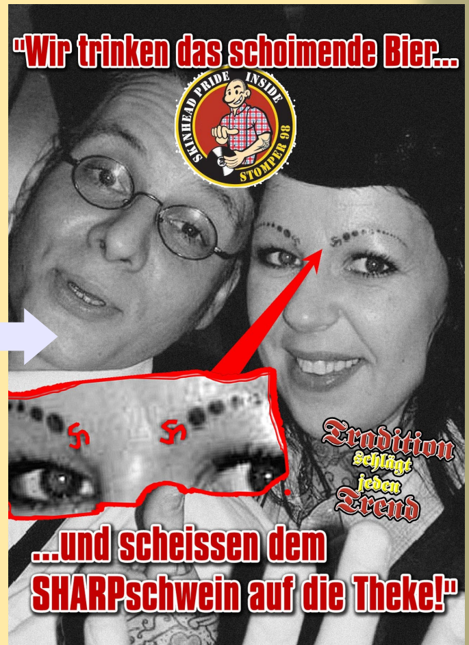
Bild links: Unpolitischer Talk über Haarsträhnenpflege in der Kneipe „Zum einarmigen Banditen“ vor einem „richtigen Skinheadkonzert“ (Hey Flacke, vielleicht erkennst Du die Frau ja... :-) brauchst nur mal ein bisschen nach rechts zu schielen). Auch hier politisch korrekt im