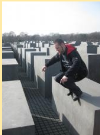
„springen gegen das vergessen“