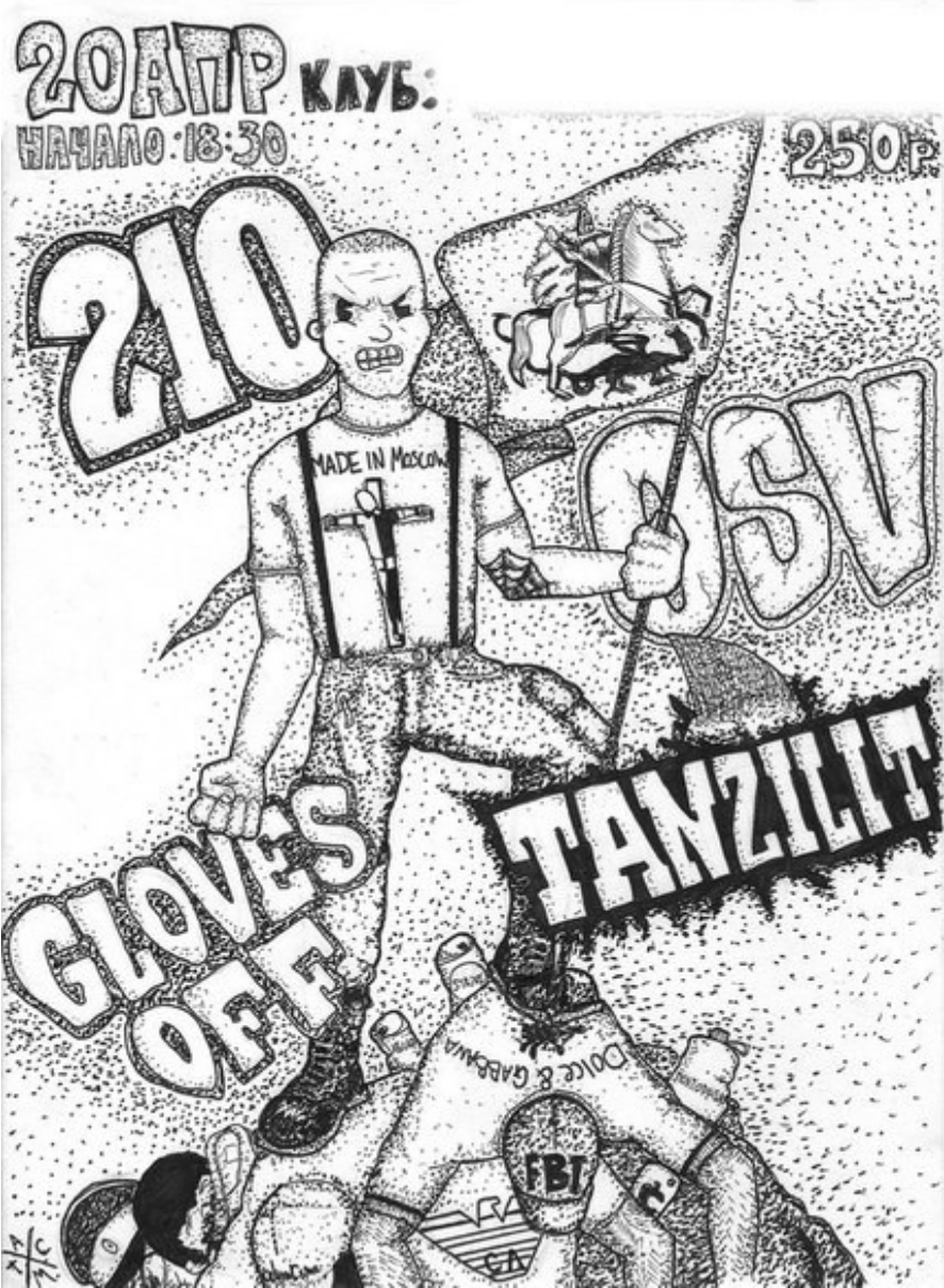
#9 – WWF-Shirt vom gleichen Grafiker des rassistischen 210-Flyers