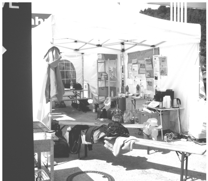
Streikzelt in Dättwil

Der Kampf wurde also komplett von der Unia übernommen und in gut sozialpartnerschaftlicher Manier abgeschwächt, ja beinahe zum Erliegen gebracht. SPAR hat bereits am Freitagmorgen den Shop wieder in Betrieb genommen. Die restliche Belegschaft wird durch Mitarbeiter_innen aus anderen Sparfilialen „unterstützt“. Und für die Entlassenen bleibt nur zu hoffen, dass