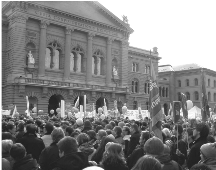
Demonstration des Staatspersonals im März 2013

47% mehr Lohn gab sich der Grossrat Anfang Juni. Zwar müssen neu alle Einkünfte aus der parlamentarischen Tätigkeit versteuert werden, doch am