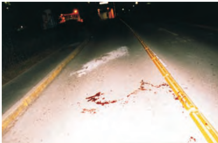
L'esito delle cariche all'interno e all'esterno del pronto soccorso (sangue in strada e all'esterno)