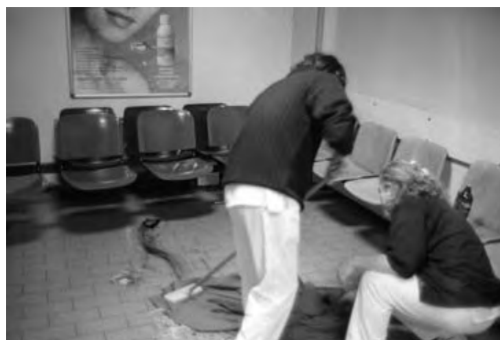
infermieri lavano il sangue a terra dopo le cariche di polizia.