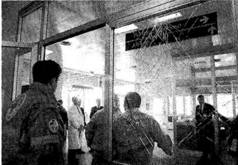
DANNEGGIAMENTI Una vetrata spaccata dopo gli scontri dell'altra notte

Un medico: abbiamo aiutato sette ragazzi e un vigilante dell'ospedale. I sindacati: fare chiarezza sul pestaggio. Le telecamere a circuito chiuso erano spente