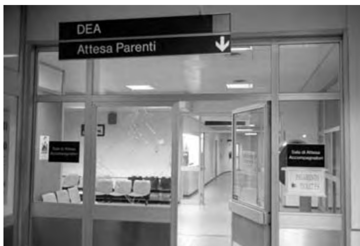
l'ingresso del pronto soccorso. vetri rotti.