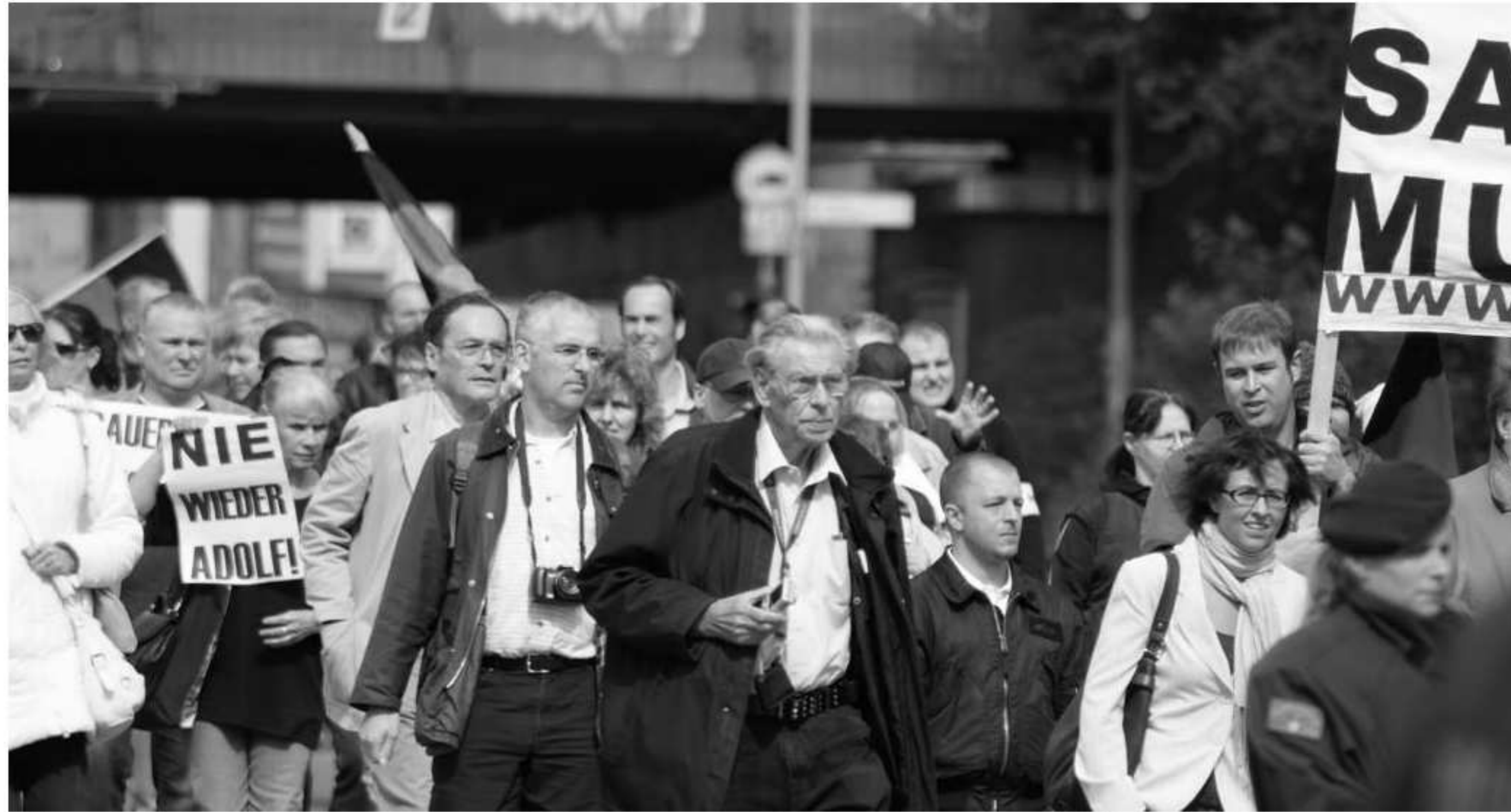
Rassist_innen von pro NRW demonstrieren gegen OB Adolf Sauerland

Die Bürgerbewegung pro NRW tut das, was sie am besten kann: Drei Mal bringt sie ihren rechtspopulistischen Wanderzirkus nach Duisburg. Im März wird aus dem groß angekündigten Sternmarsch