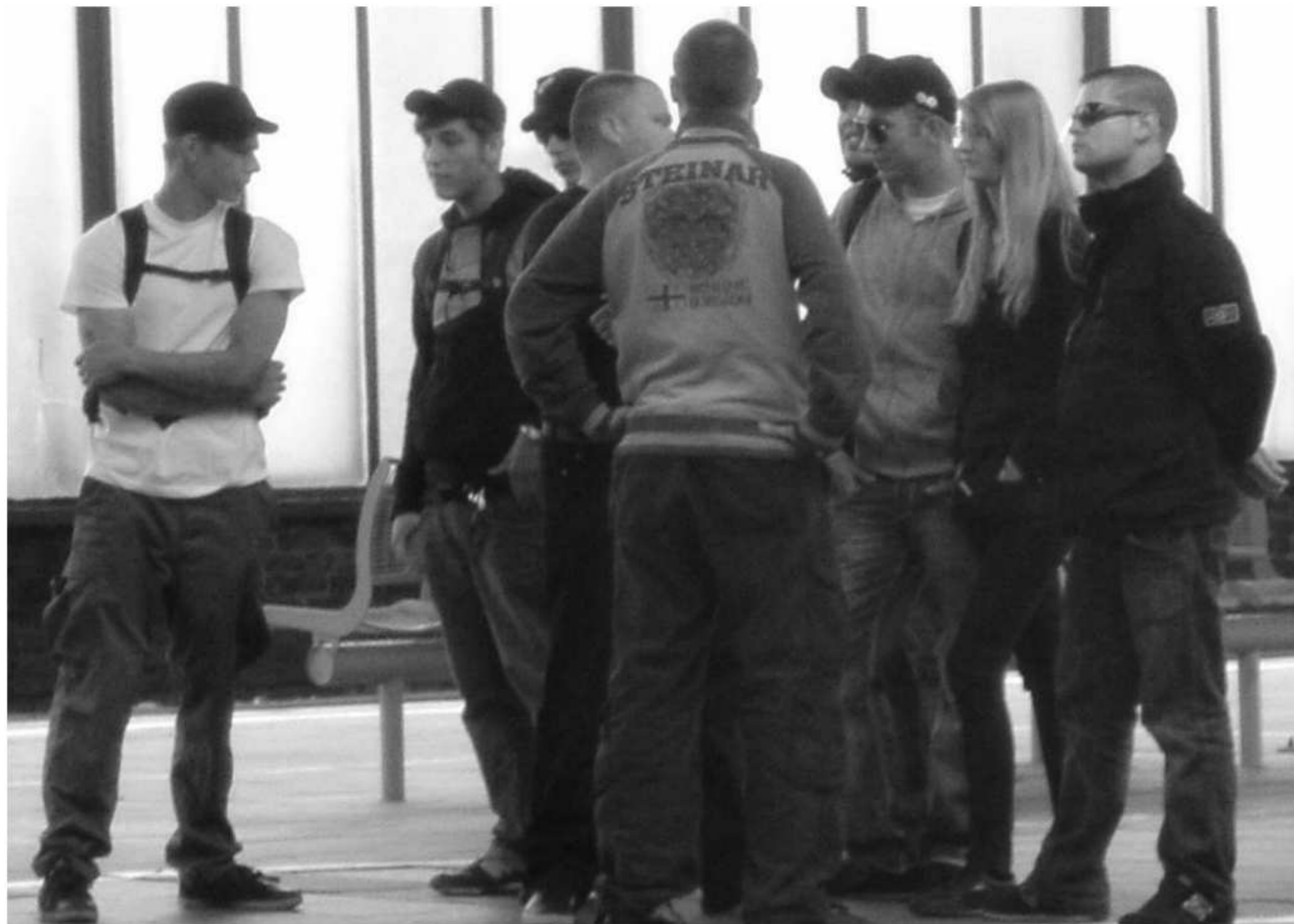
Neonazis am Duisburger Hbf bei der Anreise zu einer Kundgebung (13)

Im Laufe des Jahres vernetzen sich die Mitglieder der Kameradschaften mit weiteren Gruppen und Einzelpersonen außerhalb Duisburgs. Vor allem die „Aktionsgruppe Duisburg/Krefeld“ pflegt über die (mittlerweile aufgelöste) AG Ruhr-Mitte gute Kontakte zu den