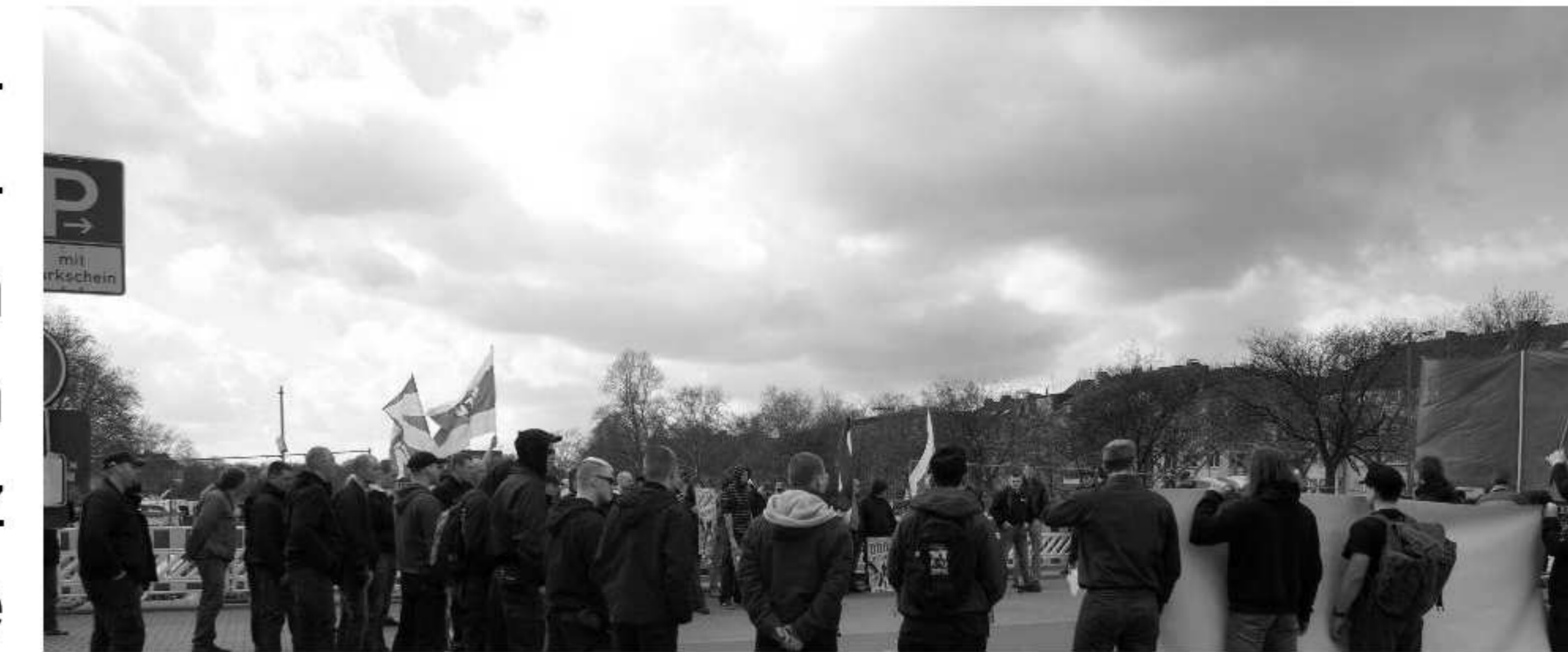
NPD-Kundgebung am 27.03.2010 auf dem Bahnhofsvorplatz

Die NPD-Duisburg ist ebenfalls nicht in der Lage öffentlich zu agieren. Zwar finden im März eine Kundgebung am Duisburger Bahnhofsvorplatz mit etwa 70 und eine Demonstration in Duisburg-