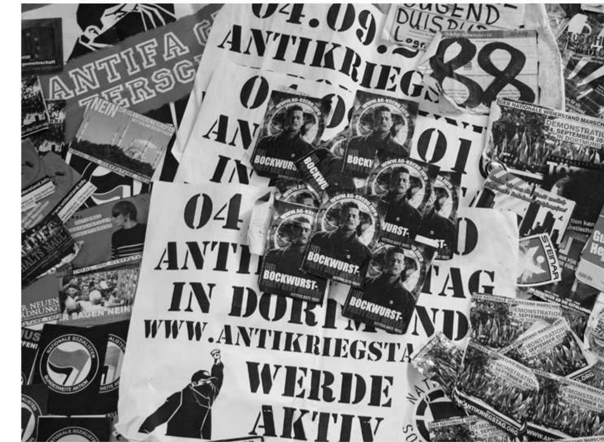
Nazi-propaganda: Aus den Stadtteilen Meiderich und Wanheim entfernte Aufkleber und Plakate