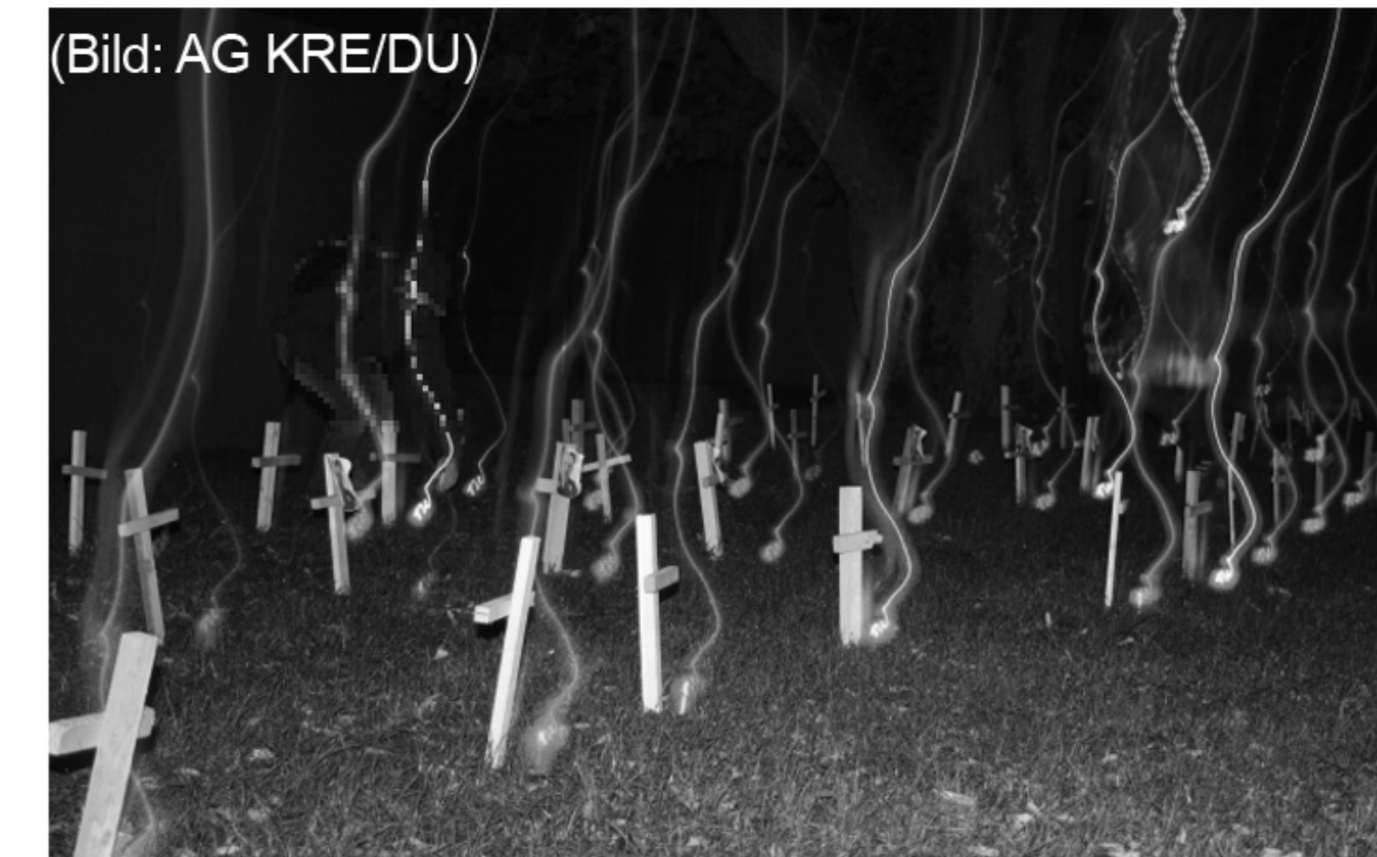
Hess Gedenken: Holzkreuze und Grablichter im Kantpark

Im Laufe des Jahres finden Personalwechsel statt: Während einige Kamerad_innen ihren Wohnort wechseln, müssen andere aus Angst vor weiteren Repressionen ihre Aktivität in der Gruppe drosseln oder ganz einstellen. Zeitgleich kommen neue Gesichter dazu.