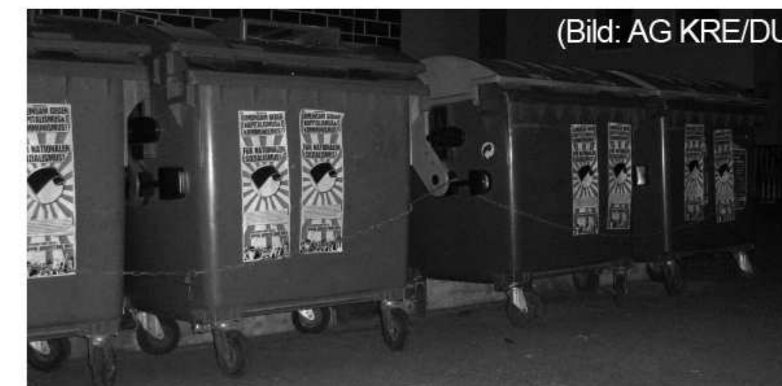
Einer der von Neonazis platierten Schulhöfe