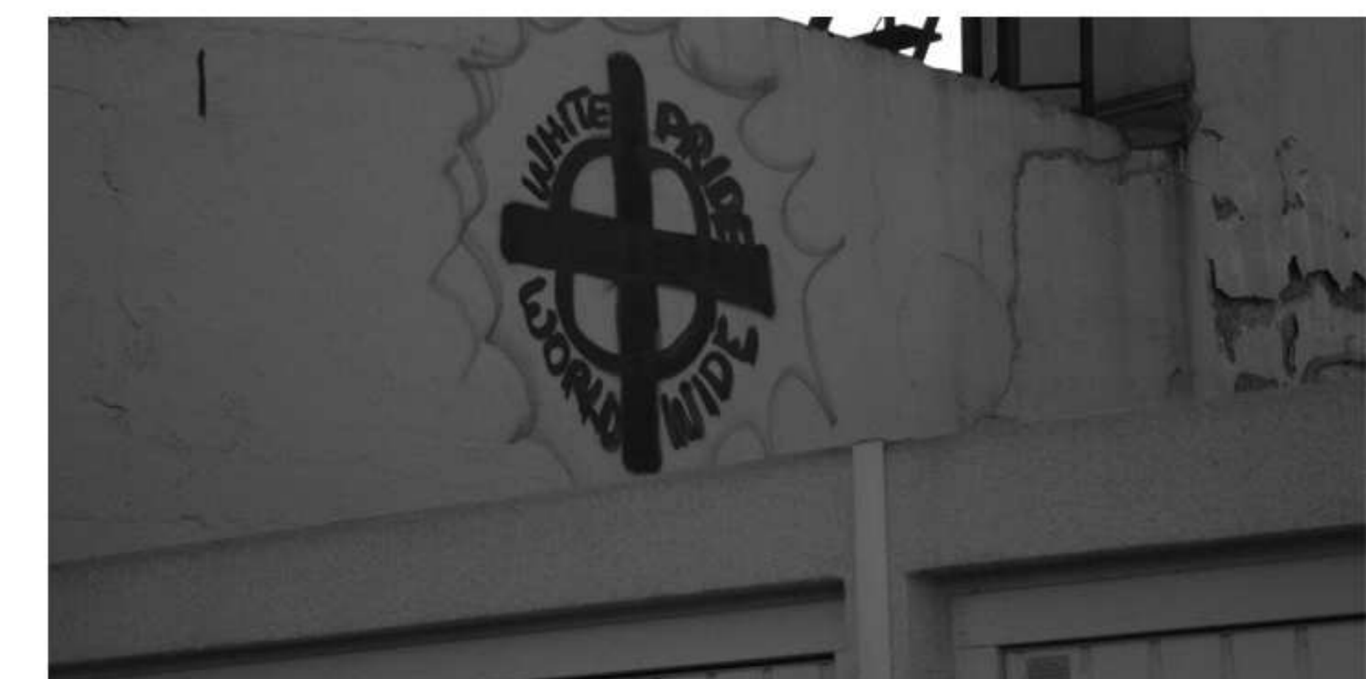
Nazi-„Kunstwerk“ in Duisburg-Walsum