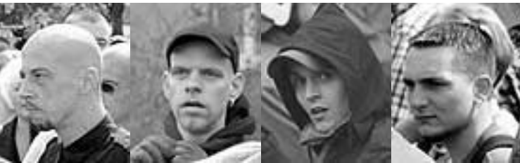
NPDler aus Pankow