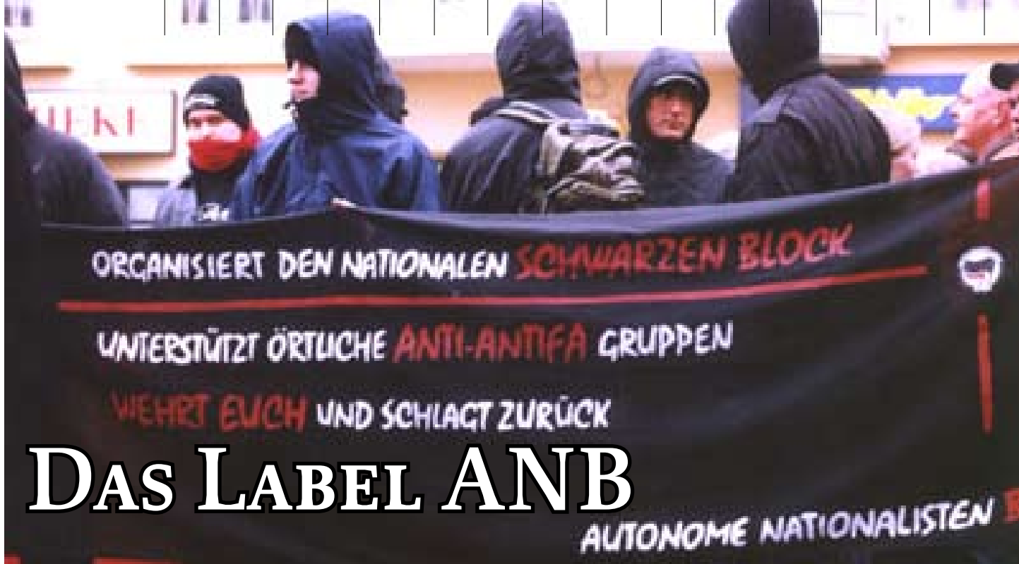
„Autonome Nationalisten“ bei einer Aktion gegen die Verurteilung der neonazistischen Band „Landser“ im Januar 2005

In der Region Berlin bestimmten in den vergangenen Jahren nicht mehr Organisationen und deren Strategien das Auftreten von Neonazis in der Öffentlichkeit, sondern ein Personenkreis von politisch aktiven Kadern. Deren jeweilige Interessen, Streitereien, Vorlieben und Lebenssituation prägen die Neonazi-Szene. Ein Machtvakuum innerhalb der Berliner Neonazi-Strukturen, das durch den Rückzug tonangebender führender Kader der alten Kameradschafts-Strukturen entstanden ist, bedingt eine spezielle Form politischer Orientierung. Die führenden Protagonisten aus der Kameradschaftsszene sagen sich zunehmend von den dogmatischen extrem rechten kulturellen Mustern los und orientierten sich an den kulturellen Codes der linksradikalen autonomen Bewegung, die sie mit eigenen Ideologie-Fragmenten versetzen. Sie treten u.a. unter dem Label „ Autonome Nationalisten “ auf. Auf der Basis des Artikels „Label ‚Autonome Nationalisten‘“ aus dem Antifaschistischen Info Blatt Nr. 69 wird, an dieser Stelle ein Überblick zu diesem Neonazi-Label geboten.