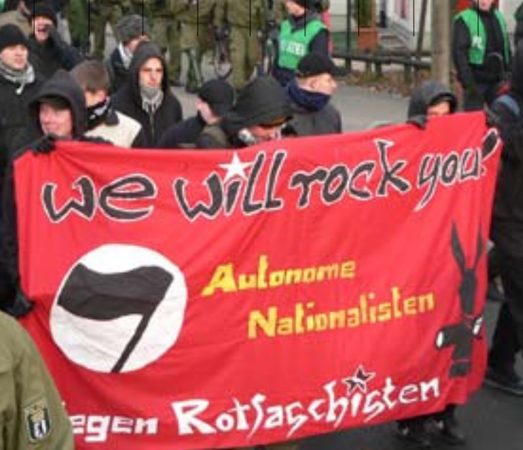
3.12.2005 Aufmarsch in Schöneeweide: Neonazis klauen antifaschistisches Kampagnemotto