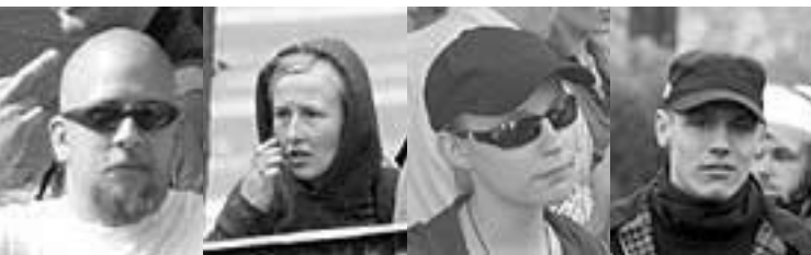
JN Aktivsten aus Pankow