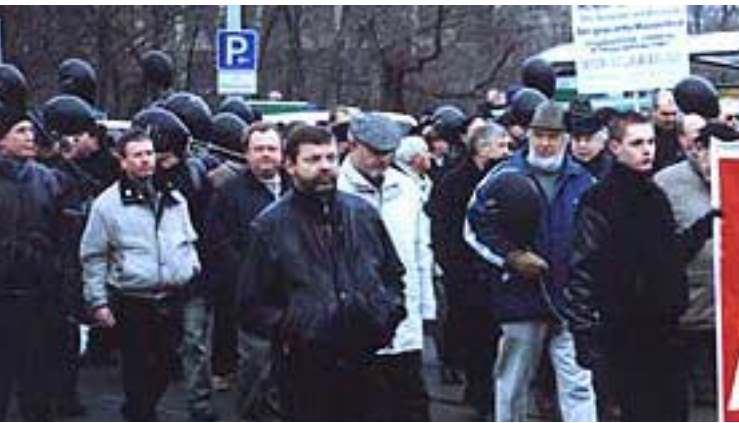
13.02.2005: Reichsbürger aus Berlin in Dresden