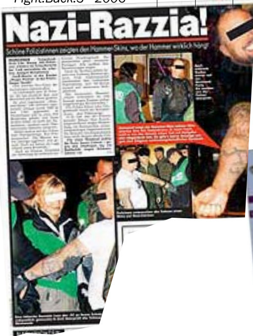
Auflösung der „Hammerskin“-Jahresparty 2004 in der Friedrichshainer „Happy Station“