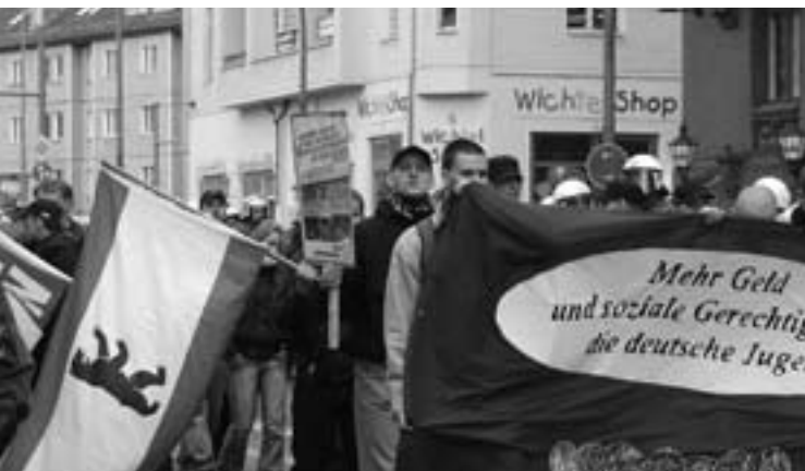
JN bei einem Aufmarsch in Pankow