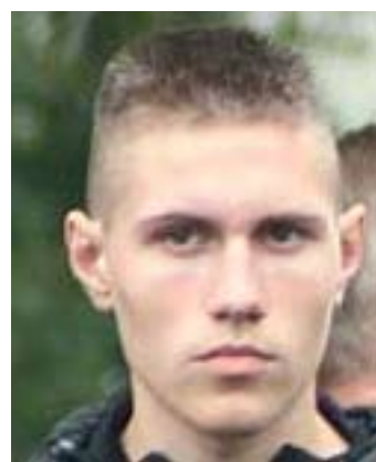
Neonazis aus Rudow

Dies ist ein Setting, das antifaschistisches Engagement nicht gerade erleichtert – aber dessen Notwendigkeit um so deutlicher macht. Hoffnungsvoll für die Zukunft darf die oben genannte Antifa-Demo vom 20. Dezember 2005 stimmen, die einen erfolgreichen Angriff auf den Mythos der Neonazi-„Homezone“ Rudower Spinne darstellte, erfreulicherweise unter reger Beteiligung örtlicher (teils migrantischer) Jugendlicher stattfand und offensiv mit Neonazi-Provokationen am Rand umzugehen wusste.