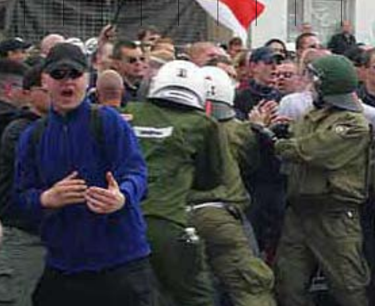
Durchbruchsversuch am 1. Mai 2004 Berlin in Lichtenberg