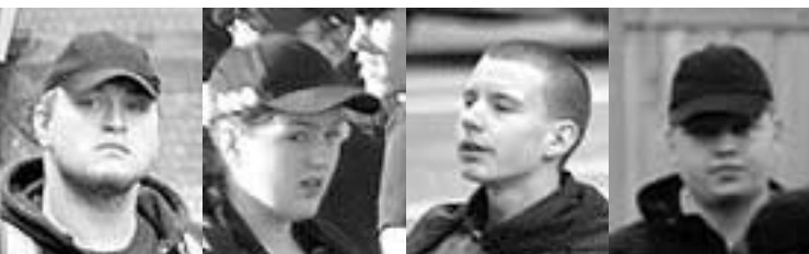
JN Aktivsten aus Pankow