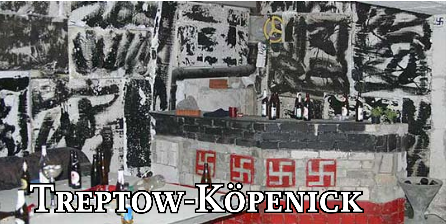
Die „Wolffschanze“: illegaler Jugendclub von Neonazis in Johannisthal

Der Bezirk Treptow-Köpenick zählt bereits seit Jahren zu einem Schwerpunkt extrem rechter Gewalt. Fast wöchentlich macht der Bezirk Schlagzeilen. Zumeist sind es Gewalttaten gegen nicht-deutsche, nicht-rechte und Andersdenkende, spontane Demonstrationen oder Propagandadelikte in Form gesprühter Hakenkreuze. Als der Berliner Innensenator Körting am 9. März 2005 die Berliner Kameradschaften „ Berliner Alternative Süd-Ost “ und die „ Kameradschaft Tor “ samt ihrer „ Mädelgruppe “ verbot, dachten viele das die Gewalttaten abnehmen. Die Statistik der Berliner Opferberatungsstelle Reach Out zeigt leider das Gegenteil auf. Im Jahr 2005 wurden 104 Gewalttaten registriert, im Vorjahr waren es 63 . Im folgenden werden wir die „Kameradschaft Berliner Alternative Süd-Ost“ sowie ihre zahlreichen Aktionen, die JN-Berlin (Stützpunkt Treptow-Köpenick) und die rechte Infrastruktur im Bezirk näher beleuchten. Wer sich einen Überblick über rechte Strukturen und Aktionen seit der Wende im Bezirk Treptow-Köpenick verschaffen will, dem seien die bereits erschienenen Ausgaben der Fight Back sowie der Süd-Ost Bote empfohlen. Zum Download unter www.treptowerantifa.de