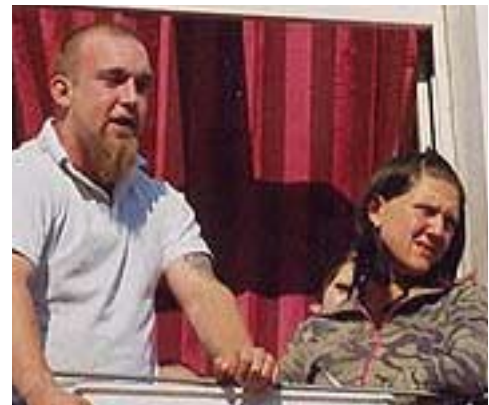
KSF [Kameradschaft Friedrichshain] Nachwuchs