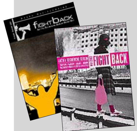
Wir beziehen uns im Folgenden auf die bereits erschienenen Ausgaben Fightback 2001 und 2003, die zumindest im Internet noch erhältlich sind.