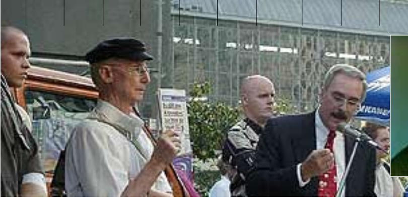
2. September 2002 REP-Kundgebung auf dem Alexanderplatz