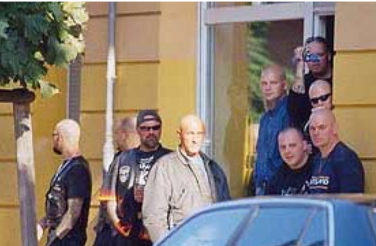
Eröffnung des Neonaziladens „Parzifal“ in Oberschöneweide