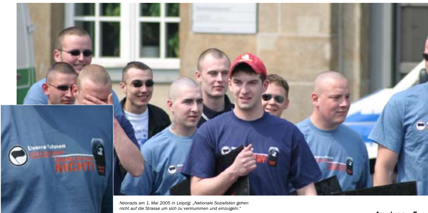
Neonazis am 1. Mai 2005 in Leipzig: „Nationale Sozialisten gehen nicht auf die Strasse um sich zu verummern und einzuigeln.“