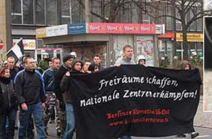
Dezember 2004: Aufmarsch der BASO in Treptow