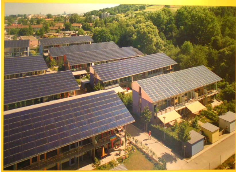
Solarsiedlung Freiburg i.Br.