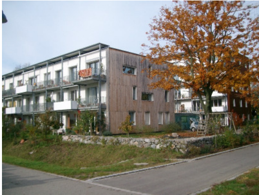
Die beiden „Kleehäuser“, Freiburg i.Br.: Passivhäuser und Zero-Häuser mit BHKW

an Primärenergieverbrauch für die Summe aller Zwecke, d.h. Wohnen, Mobilität, Ernährung, Konsum incl. Industrie und Gewerbe sowie Dienstleistungen aller Art (1/3 des heutigen Verbrauchs pro Kopf in Deutschland). Davon soll höchstens ein Viertel für das Wohnen, also für Heizen, Lüften, Kochen, Warmwasser und Strom in Anspruch genommen werden, ein Viertel für die Mobilität, zwei Viertel für Konsum und Dienstleistungen. Die Erzeugung soll zu über 75 Prozent auf erneuerbaren Energien beruhen, d.h. nur ein Zwölftel des heutigen Bedarfs auf fossiler Basis. Die 2000-Watt-Gesellschaft wurde in Basel-Stadt als Pilotprojekt entwickelt und bei einer Volksabstimmung in Zürich als Ziel angenommen.