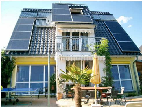
Passivhaus mit Solarwärme- und Solarstromanlage, Breisach

Passivhäuser sind in Freiburg vom Gemeinderat 2008 als künftiger Mindest-Baustandard auf kommunalen Grundstücken und bei anderen Einwirkungsmöglichkeiten beschlossen worden. Dem Passivhaus-Standard nahe kommt der bis Ende 2009 gültige KfW-40-Förder-Standard, bei dem der Primärenergiebedarf für Heizung, Warmwasser und Haustechnik-Strom maximal 40 kWh/m 2 und Jahr beträgt, und der wiederum dem neuen Förderstandard KfW-Effizienzhaus 70 (ENEc 2009) nahekommt.