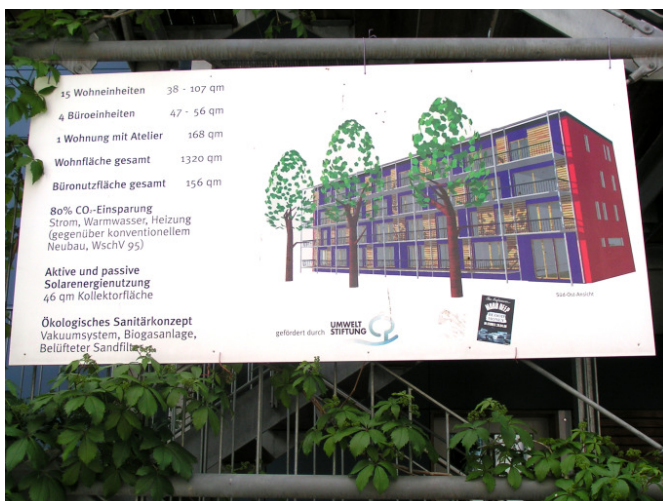
MFH-Passivhaus „Wohnen und Arbeiten“ mit BHKW, Freiburg i-Br.

Gute Erfahrungen bei Neubau-Passivhäusern liegen insbesondere im Freiburger Stadtteil Vauban vor. Zwei Pionierobjekte sind das kostengünstige Haus „Wohnen und Arbeiten“ von 1999 als erstes deutsches Mehrfamilienhaus im Passivhaus-Standard und die „Kleehäuser“ (2006), ein fortgeschrittenes öko-soziales Folgeprojekt als Zerohaus, d.h. ohne Netto-Treibhausgas-Ausstoß, allerdings unter Zuhilfenahme gebäude-externer Maßnahmen. „Wohnen und Arbeiten“ wurde von der Deutschen Bundes-Umweltstiftung gefördert für die „Energetische Optimierung eines fünfgeschossigen Wohn- und Bürogebäudes - Zukunftsfähiges Arbeiten & Wohnen“ und das Sanitärkonzept. Es verfügt über viele innovative Bauausführungen und ein Erdgas-Mini-Blockheizkraftwerk (BHKW) mit fünf kW el .