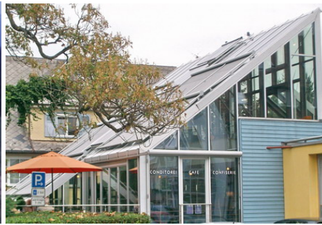
Solarcafé (2009)

Der 1000 m hoch gelegene Rappenecker Hof zwischen Schauinsland und Oberried ist seit 1987 Forschungsobjekt des Fraunhofer ISE (Freiburg) und die erste solarbetriebene Gaststätte in Europa. Die Solarstromanlage (40 m 2 , 4 kW) und eine 1-kW-Windkraftanlage versorgen den Berggasthof mit Strom (70 Prozent bzw. 15 Prozent) im Inselbetrieb. Gespeichert wird der Strom in Akkus mit zirka 50 kWh Kapazität. Zwei 5-kW- bzw. 3,5-kW-Wechselrichter erzeugen Wechselstrom. Stromsparmaßnahmen sollen den Verbrauch auf zirka 3250 kWh/Jahr senken. Als Reserve dient ein Dieselmotor (16 kW, Ziel nur 15 Prozent des Strombedarfs, nur noch 500 statt 6000 l Heizöl/Jahr), der ab 2003 versuchsweise von einem Brennstoffzellen-Kleinkraftwerk ersetzt wird. Beheizt wird das Gebäude mit Holz. www.rappeneck.de