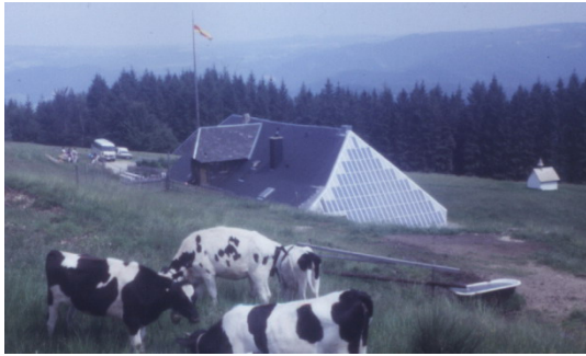
Rappenecker Hütte (Foto 1987)