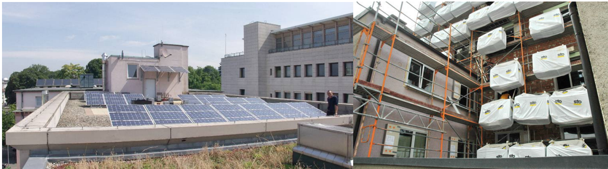
Solargeneratoren und -Kollektoren auf dem Dach. Umbau (Hinterhaus) zum Passivhaus-Standard.

Die Heizungsanlage wurde 2002 von Öl (50 m 3 /Jahr) auf Holzpellets (100 m 3 /Jahr) und Solarwärme (30 m 2 ) umgestellt. Der vollautomatische Pelletkessel hat 300 kW, bis 92 Prozent Wirkungsgrad, eine Rauchgasreinigung und kostete 46.000 €. Die Solarwärmanlage deckt an schönen Tagen den Bedarf für Duschen und Waschen. Wassersparmaßnahmen gehören dazu. Die Fenster im historischen Gebäudeteil besitzen Dreifach- und Schallschutzverglasung. Das rückwärtige Gebäude (s. Abb.) wird 2009 auf nahezu Passivhaus-Standard modernisiert und dann fast keine Heizenergie mehr benötigen.