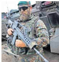
Das Sturmgewehr G36, heißt es, hat in der Bundeswehr keine Zukunft.