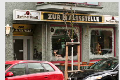
Gaststätte „Zur Haltestelle“ Brückenstraße 3