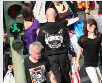
Gremium MC Rocker