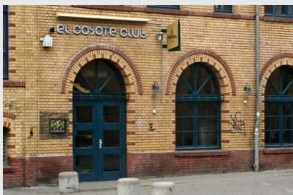
„El Coyote Club“ Edisonstraße 63