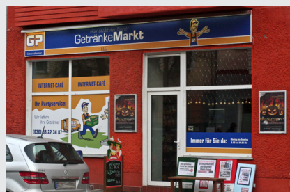
„GetränkePartner“-Getränkemarkt Brückenstraße 7