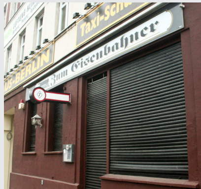
Kneipe „Zum Eisenbahner“ Michael-Brückner-Straße 6