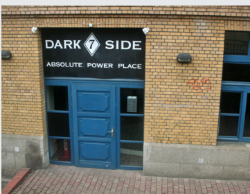
„Dark7side“ Edisonstraße 63