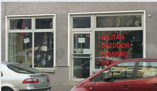
Naziladen „Hexogen“ Brückenstraße 9