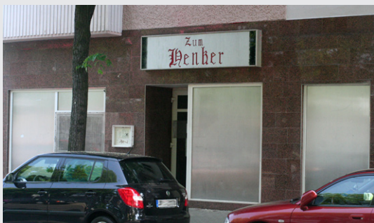
Kneipe „Zum Henker“ Brückenstraße 14