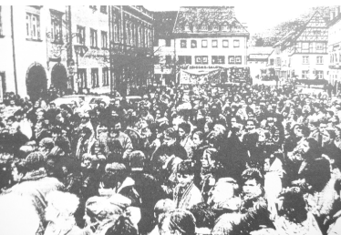
Demo nach dem Brandanschlag in Waldkirch

Bestärkt auch von der sogenannten „Wiedervereinigung“ und dem dadurch erstarkten Nationalismus kam es zwischen Teilen der Bevölkerung, der Politik und der rechtsextremen Szene zu einer gewissen Arbeitsteilung. Der öffentliche Diskurs gegen die vermeintlichen „Schein-Asylanten“ wurde aus der Mitte der Gesellschaft bedient, die Politik in Baden-Württemberg begann mit einer Lagerpolitik für Geflüchtete und der rechte Mob zündete die Unterkünfte an. 1992 zog die Partei „Republikaner“ mit knapp 11 % in den baden-württembergischen Landtag ein.