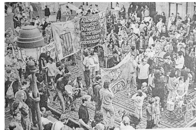
Linke Demo gegen das neue Bezirkssammellager 1992