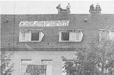
Dachbesetzung des neuen Bezirkssammellagers auf Vauban 1992

Diese warnten vor der „Unterwanderung des deutschen Volkes durch den Zuzug von Millionen von Ausländern“. Die „Asylmissbrauch“-Hetze gegen Geflüchtete, die Anfang der Achtziger begann und bis heute weitergeht, hatte einen massiven Abbau der Rechte Geflüchteter und die faktische Abschaffung des Grundrechts auf Asyl im „Asylkompromiss“ von 1993 zur Folge.