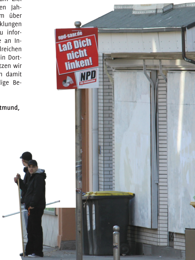
Zwei bewaffnete Neonazis haben sich vorm „Nationalen Zentrum“ postiert.

Antifaschistische Union Dortmund, Januar 2011