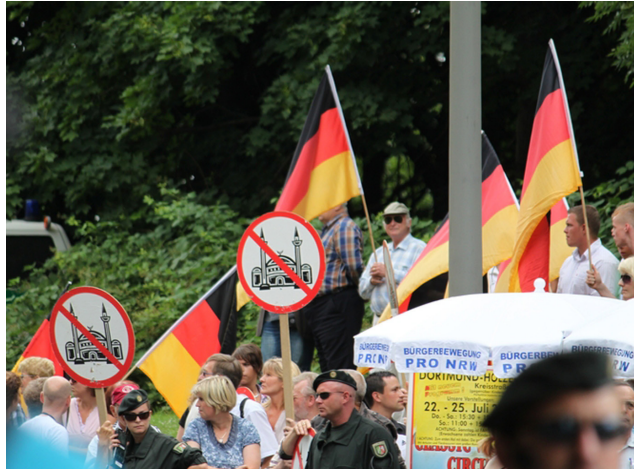
pro NRW-Kundgebung im Juli 2010 in Dortmund - Hörde