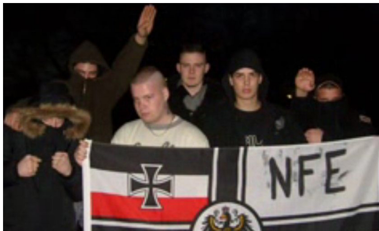
NFE-Mitglieder mit Hitlergruß und Reichskriegsflagge

am 30.05.2008 die Polizei, nachdem eine offensichtlich rechtsgerichtete 20-30-köpfige Personengruppe in Dortmund-Brechten lauthals rechte Parolen skandiert hatte. Die Polizei konnte allerdings nur noch zwölf männliche Personen im Alter von 16-23 Jahren aufgreifen, von denen der überwiegende Teil bereits einschlägig polizeilich erfasst war. Danach wurde es immer stiller um die Gruppe. Es tauchten zwar noch vereinzelt Schmierereien mit dem Gruppen-Kürzel in Verbindung mit neonazistischen Sprüchen und Symbolen auf, doch eigenständige Aktivitäten waren nicht mehr wahrnehmbar. Schließlich wurde die eigene Homepage vom Netz genommen und die Gruppe löste sich dann stillschweigend im Jahr 2009 de facto auf.