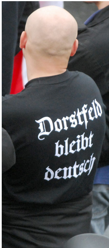
'Dorstfeld bleibt deutsch' Dumpfe Parolen kennzeichnen die T-Shirts der „Kameradschaft“

terschiedlicher Gruppenstärke besuchen die Neonazi-Skins regelmäßig öffentliche Versammlungen der extremen Rechten, sind dort aber auch nicht tiefergehend in