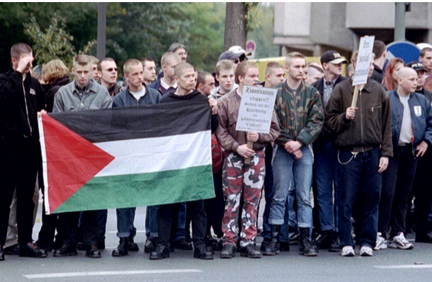
Naziaufmarsch im Oktober 2000 in Dortmund: Damals noch ohne „Autonome NationalistInnen“

Die Dortmunder Neonaziszene in ihrer heutigen Ausprägung kann zum Teil auf eine jahrzehntelange Tradition zurückblicken. Im Laufe der Jahre haben die Dortmunder Neonazis mehrere Kameradschaften hervorgebracht und verschiedene Strukturen, Bewegungen und Konzepte erprobt, die heute kennzeichnend für den „Pluralismus“ und das breite Organisationsspektrum der hiesigen Neonaziszene sind. Eine dauerhafte Konstante war dabei aber immer ihre Gewaltbereitschaft, die in Dortmund gleich mehrere Todesopfer forderte.