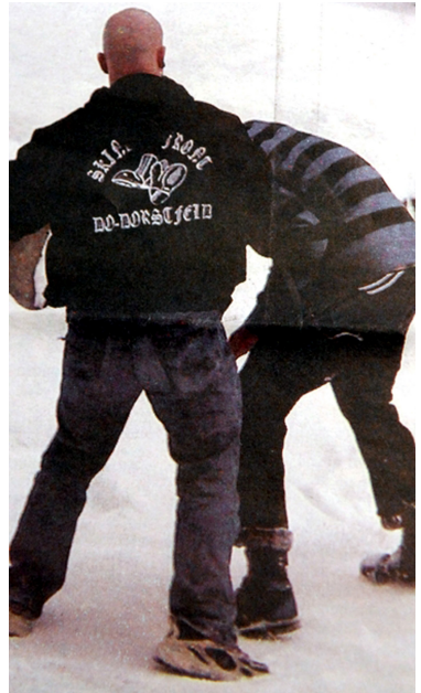
Mitglied der Skinhead-Front prügelt auf Demonstranten ein

gestellt hatte. Der Täter war aktives Mitglied der Skinhead Front und ist auch nach seiner kürzlich erfolgten Haftentlassung wieder in deren Reihen aktiv. Vermutlich waren es auch Mitglieder dieser Gruppierung, die im September 2006 mehrere Jugendliche jeweils in der Nähe der S-Bahnhaltestelle Dortmund-Dorstfeld mit Baseballschlägern und Reizgas bewaffnet angegriffen hatten und ihre am Boden liegenden Opfer mit Stiefeln traten. Im Februar 2009 griffen Neonazis auf einer Chemnitzer Raststätte AntifaschistInnen an, die sich