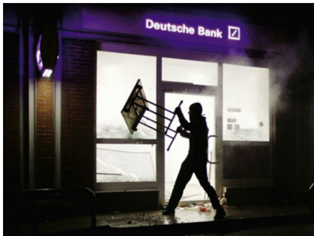
Mai-Randale in Hamburg: Unerwartete Eskalation

Das Problem der Polizei ist, dass seit Heiligendamm eine neue Generation am Werk ist, die weniger Wert auf Theorie und mehr Wert auf Praxis legt. Früher war die Welt der Autonomen überschaubar. In Berlin und Hamburg gab es einen harten Kern von Aktivisten, Brandanschläge wurden penibel vorbereitet und durch Erklärungen begleitet. Wenn es brannte, gerieten die üblichen Verdächtigen ins Visier, „das war alles wenig überraschend“, sagt ein Fahnder.