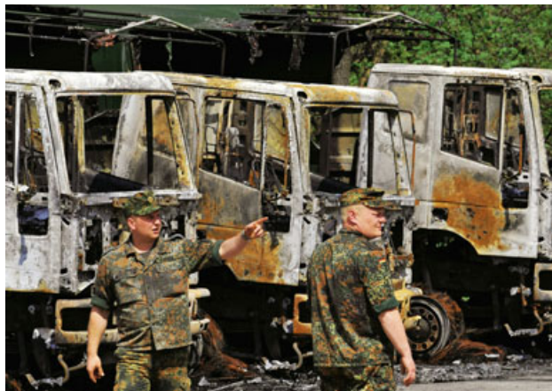
Bundeswehrfahrzeuge in Dresden: Generation Grillanzünder

Einen großen Bogen kann er schlagen von den Zapatisten über das Widerstandsrecht gegen Diktatoren, von „Ulrike“, gemeint ist Meinhof, zu den brennenden Autos von Berlin. Je mehr Nobelautos in der Innenstadt brennen, desto mehr Investoren würden verschreckt. Das Konzept gehe auf. Es gebe Häuser, für die sich kein Investor mehr finde.