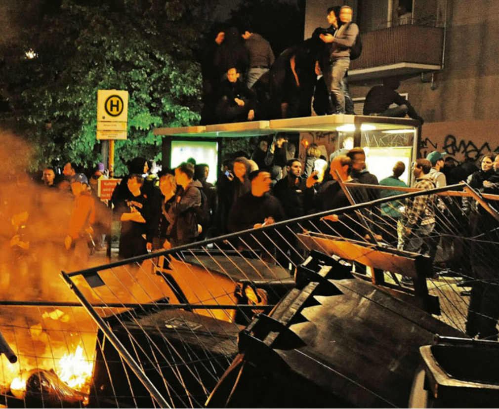
Mai-Ausschreitungen in Berlin-Kreuzberg „Wo gehobelt wird, da fallen Späne“