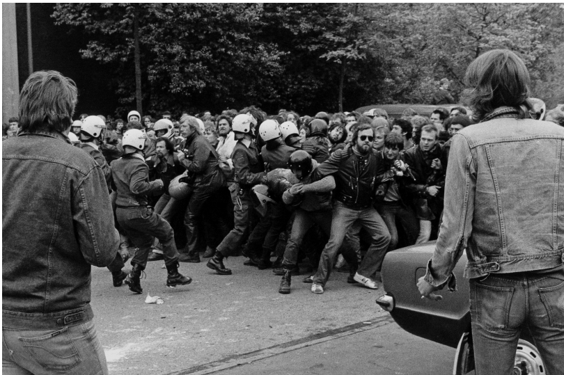
NPD – Parteitag in Witten 1983.