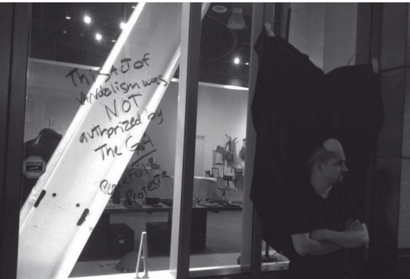
Uneinigkeit über die Rolle der Generalversammlung während Occupy Oakland.

Eine der tragfähigsten Versionen dieser Idee ist die digitale Demokratie, oder E-