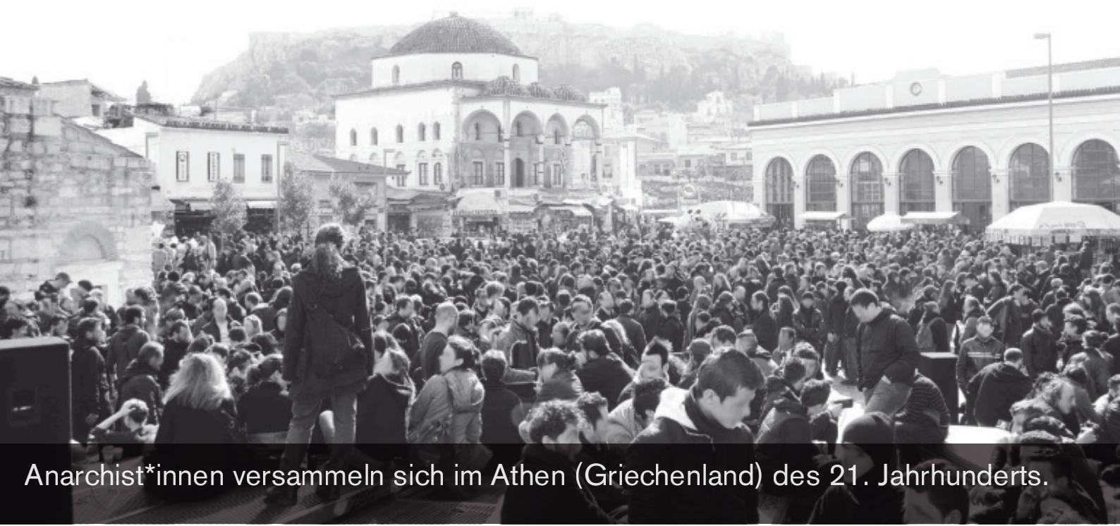
Anarchist*innen versammeln sich im Athen (Griechenland) des 21. Jahrhunderts.

Nächstes Mal wenn sich ein Fenster für solche Möglichkeiten öffnet, lasst uns, anstatt wieder einmal die „richtige Demokratie“ neu zu erfinden, uns die Freiheit zum Ziel nehmen – die Freiheit selbst.