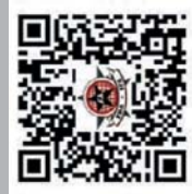
Alle Ausgaben unter: www.fda-ifa.org/gaidao

Wir behalten uns natürlich vor, zugesandte Beiträge nicht zu veröffentlichen, die unsere Prinzipien im Besonderen und die des Anarchismus im Allgemeinen entgegenstehen oder diese unsolidarisch diffamieren.